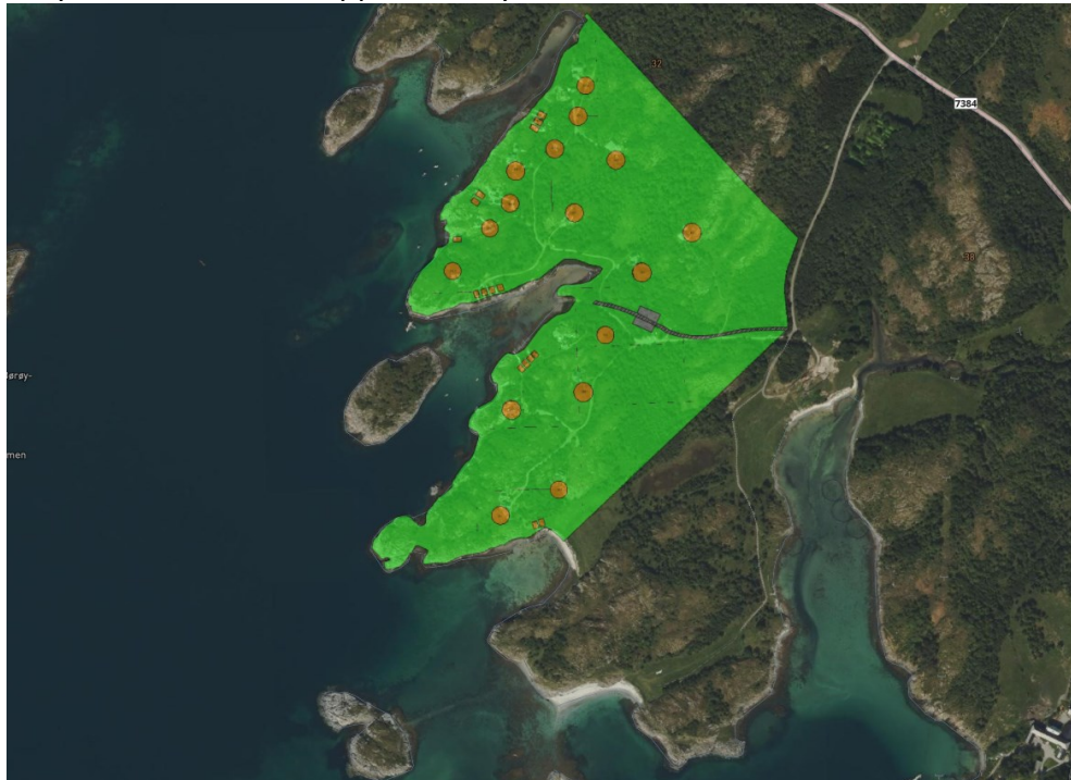
Utsnitt flyfoto og gjeldende reguleringsplan

Detaljreguleringsplan for Husby hyttefelt ble vedtatt 12.12.2000 og planene er i dag fullt utnyttet ved at det er oppført 16 hytter i feltet.